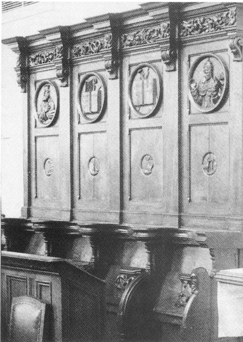
Nederweert, Sint-Lambertuskerk: koorgestoelte met neo-barokke rugschotten.